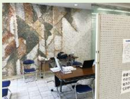
輪島市役所仮設相談ブース