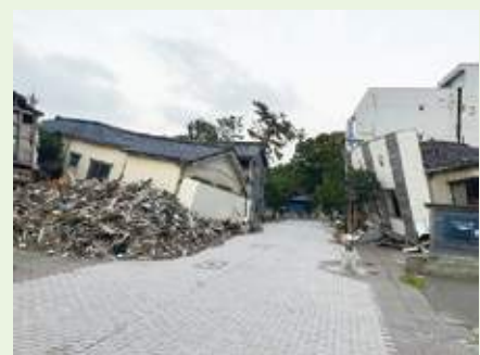
倒壊して放置されたままの現地