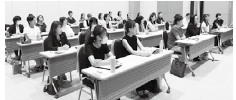
真剣に聞き入る参加者の皆さん

参加者からは、「経営計画書の大切さを改めて知った」、「人間関係は難しいが、本音で意見を述べ合うことで真の信頼関係が生まれ、より強固な組織が出来る」、「自分が自分ではなく、思い切って部下や後輩に任せることも成長を促す要因であり必要なことと分かった」、「女性の社会進出について経営面・マインド面の両視点からお話し、成功例だけではなく失敗例についてもオープンに話されていた部分に魅了された」といったような感想をいただきました。参加された約30名の皆さんが、有意義な時間を過ごされたと確信出来るセミナーでした。