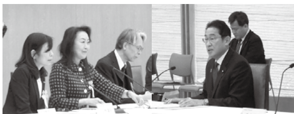
会議の様子(豊田会頭(左)、岸田内閣総理大臣(右))