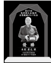
優勝者トロフィー