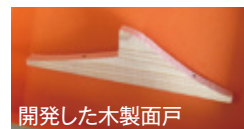
開発した木製面戸

昨年夏に試作を行い、9月には「木製面戸」の意匠出願を行いました。材質は静岡県産のヒノキとモミの2種類を計画。今後「木製面戸」は当社で使用するだけでなく、全国の瓦屋根工事業者に向けて商品化し販売していきます。